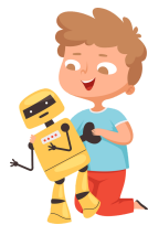
Taller de Robótica