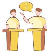
Club de Debate Escolar para Secundaria