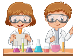
Club de Ciencias