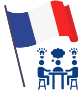
Club de Francés